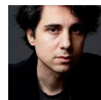
JONÁS TRUEBA REGISTA E SCENEGGIATRICE VOLVERÉIS