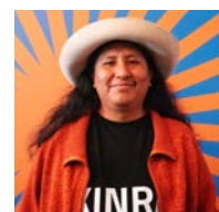
MARCO PANATONIC REGISTA E SCENEGGIATORE KINRA

Con uno stile visionario e poetico, il film racconta la vita e la misteriosa morte di Neirud, una militante queer durante la dittatura brasiliana. Attraverso un montaggio che intreccia archivi reali e immaginari, Fernanda Faya realizza un'opera che interroga la memoria collettiva e l'invisibilità storica delle minoranze. Premiato con una menzione speciale al Festival de Brasília, il film è stato selezionato in numerosi festival internazionali dedicati al cinema LGBTQ+ e alla riflessione storica. Un documentario lirico e necessario, che riporta alla luce ciò che troppo a lungo è stato sepolto.